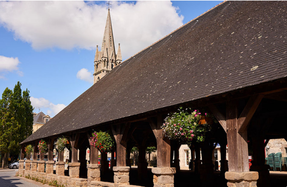
Les Halles